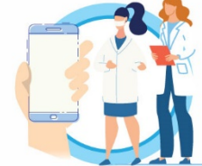
В СЛУЧАЕ ЗАБОЛЕВАНИЯ ОБРАЩАЙТЕСЬ К ВРАЧУ