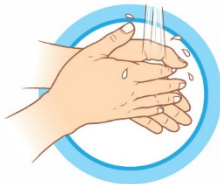
ЧАСТО МОЙТЕ РУКИ С МЫЛОМ