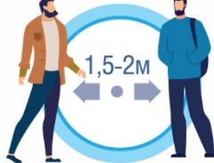
СОБЛЮДАЙТЕ РАССТОЯНИЕ И ЭТИКЕТ